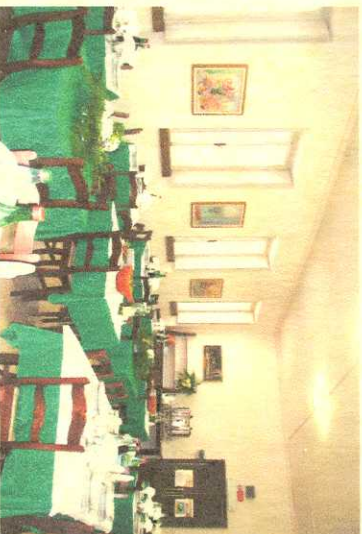
APERTURA: stagionale, da aprile ad ottobre